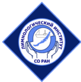
ЛИН СО РАН

Мероприятие проводится при участии и поддержке: